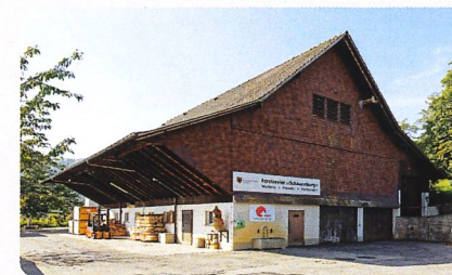
Hof Ebnet, Forstbetrieb