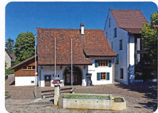
Bürgerhaus mit Museum, Döbelihaus