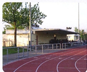
Stadion «In den Sandgruben»

So unterstützt die Bürgergemeinde regelmässig Prattler Vereine, lokale Institutionen und Schulen mit finanziellen Beiträgen, Naturalien, Brennholz oder Bürgerwy.