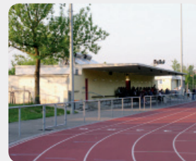
Stadion «In den Sandgruben»

So unterstützt die Bürgergemeinde regelmässig Prattler Vereine, lokale Institutionen und Schulen mit finanziellen Beiträgen oder mit Naturalien wie Weihnachtsbäume, Brennholz oder Bürgerwy.