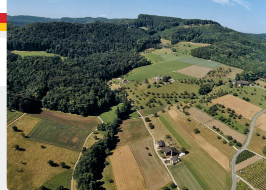
Talweiher, Talhof und Ebnet (oben im Bild)

Als Liegenschaften besitzt die Bürgergemeinde die Alte Wacht (Verwaltung/Büro seit 2015), das Bürgerhaus (Ortsmuseum, Wohnung), den Hof Ebnet (Forstbetrieb, Wohnhaus), den Talschopf (Holzlager), den Talhof (Landwirtschaftsbetrieb verpachtet) sowie das Aerni- und das Döbelihaus (Mietwohnungen).