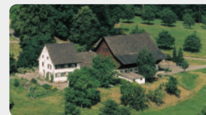
Hof Ebnet, Forstbetrieb