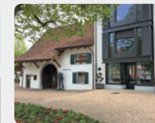
Bürgerhaus mit Museum, Döbelihaus